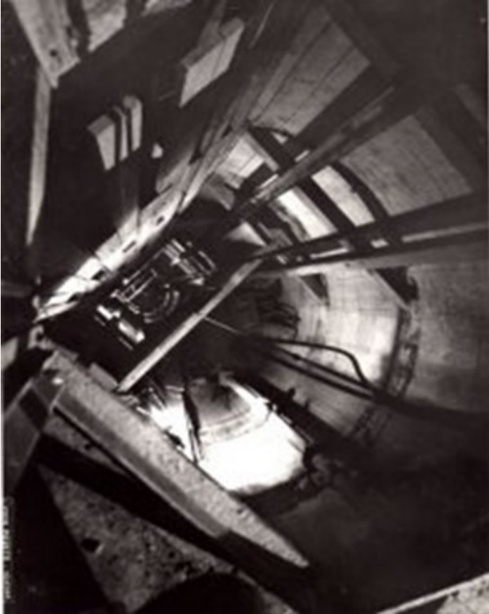
Montevecchio, Ventilazione artificiale - ventilazione principale: due pozzi ( http://www.minieramontevecchio.it/ )