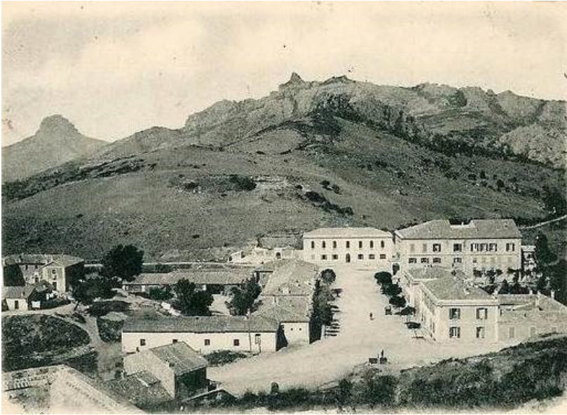
Miniera di Montecatini ( http://www.minieramontecatini.it/ )