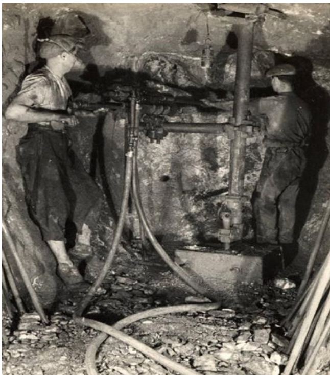
Montevecchio, Perforazione ad acqua ( http://www.minieramontevecchio.it/ )

Va inoltre sottolineato il notevole dispendio di risorse economiche utilizzate per portare avanti il piano preventivo che, in un periodo particolarmente difficoltoso come quello del conflitto mondiale e quello immediatamente successivo, testimonia la costante attenzione della Società per la tutela delle maestranze alle sue dipendenze.