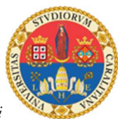
Università degli studi di Cagliari

Sono stati concessi i seguenti patrocini di