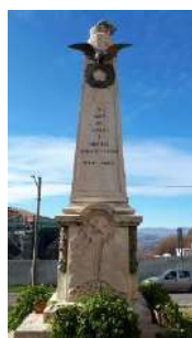
12. Monumento ai caduti