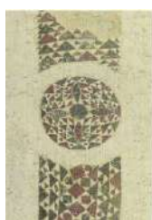
8. Facciata occid.part. San Giovanni B..