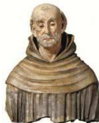
9. Busto San Bernardino Chiesa San Francesco