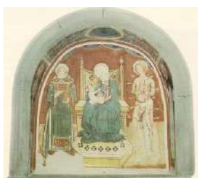
4. Madonna con Bambino tra santi (San Carlo)