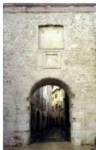
13. Porta Burgi Piazza San Francesco