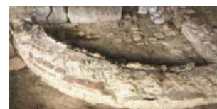
15. Struttura muraria B Terme di Carsulae

Si stanno altresì concludendo i lavori della facciata di San Francesco, compreso il dipinto murale posto nella nicchia