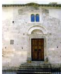
7. Portale cosmatesco San Giovanni Battista