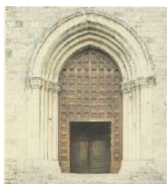
2. Fonte battesimale S. Giovanni Battista