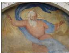
11. Lunetta con affresco Chiesa del Duomo