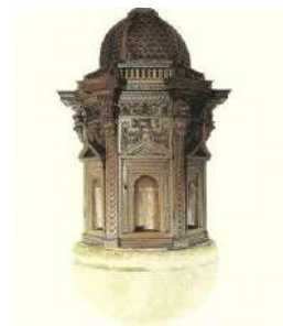
5. Portale lapideo San Francesco