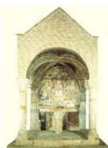
3. Madonna in trono con Bambino (San Carlo)