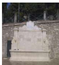
6. Fontana monumentale Piazza San Francesco