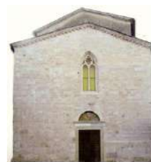
10. Facciata Chiesa del Duomo