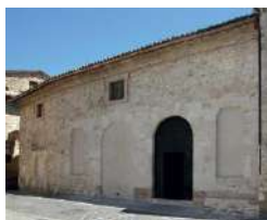
14. Facciata S.M. de Incertis (San Carlo)